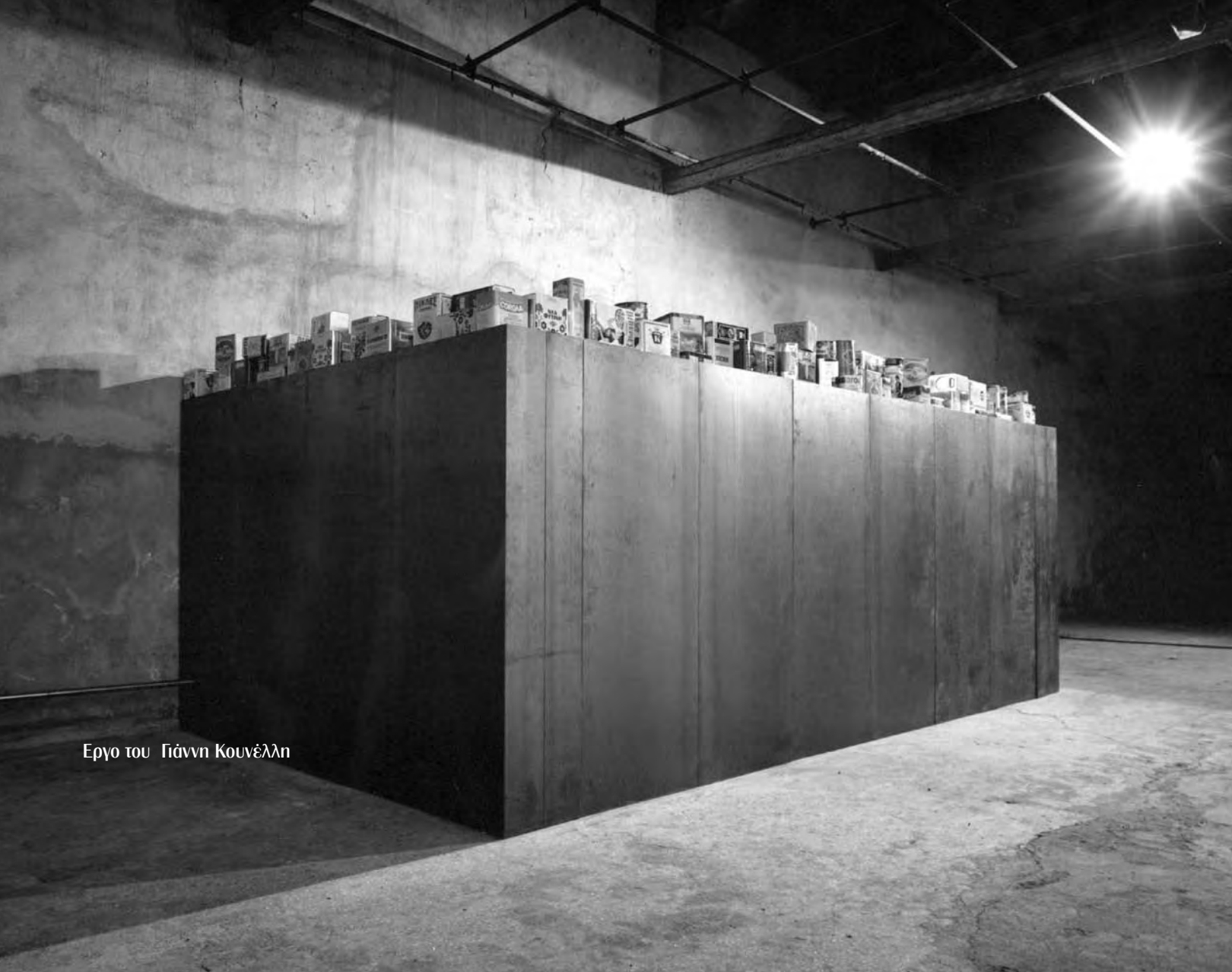
Εργο του Γιάννη Κουνέλλη