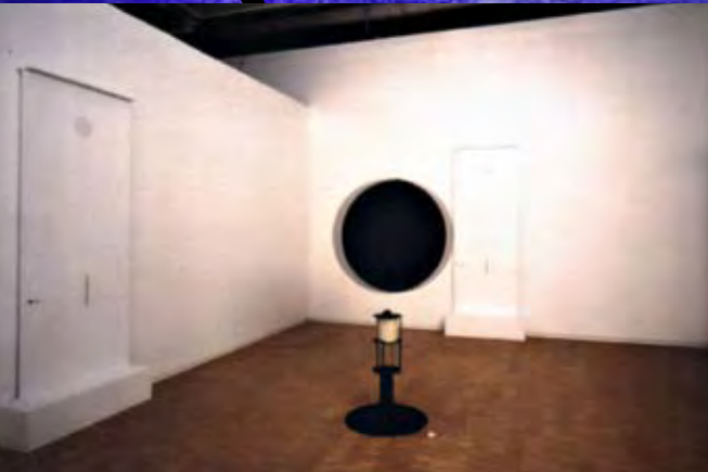
Έργο του Takis

Σ ΤΗΝ ΕΚΘΕΣΗ-ΔΗΜΟΠΡΑΣΙΑ «ΚΑΤΟΠΤΡΑ ΜΟΥΣΙΚΗΣ - ΣΥΝΕΙΔΗΣΗ ΙΣΤΟΡΙΑΣ» ΓΙΑ ΤΗΝ «ΕΛΛΗΝΙΚΗ ΤΕΧΝΗ ΤΟΥ 20ΟΥ ΑΙ.» σπουδασίαι σύγχρονοι Έλληνες εικαστικοί - και ευάριθμοι Ξένοι- κατέθεσαν με τα έργα την δική τους προσφορά στο Όραμα του κτηρίου της Εθνικής Λυρικής Σκηνής και της Μουσικής Ακαδημίας. Ανάμεσά τους οι Valerio Adami, Γιώργος Γυπαράκης, Βλάσσης Κανιάρης, Νίκος Καναρέλης, Χρίστος Καράς, Racid Khimoune, Γιάννης Κουνέλης, Βασίλης Κυπραίος, Γιώργος Λαζόγκας, Μανώλης Μπαμπούσης, Χρίστος Μπότσογλου, Γιώργος Ξένος, Ναυσικά Πάστρα, Παύλος, Γιώργος Ρόρρης, Τάκης, Κώστας Τσόκλης, Πάνης Φωκάς, Παντελής Χανδρής. Καλλιτέχνες που πρωταγωνίστησαν μαχητικά στην ευρωπαϊκή πρωτοπορία και καλλιτέχνες που διαμορφώνουν την τέχνη του σήμερα. Παράλληλα με την έκθεση στους Κυλινδρόμυλους Σαραντοπούλου σε επιμέλεια του Μάνου Στεφανίδη διοργανώθηκε και Δημοπρασία στο Εθνικό Ίδρυμα Ερευνών (2-12-2003 έως 10-1-2004).